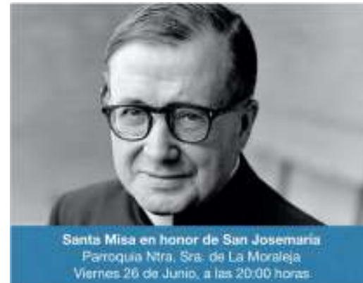
Santa Misa en honor de San Josemaría Parroquia Ntra. Sra. de La Moraleja Viernes 26 de Junio, a las 20:00 horas.