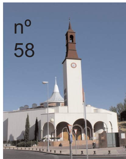
C/ Nardo 44, 28109, Alcobendas (Madrid) Tlfno: 91 662 62 24.

No podemos creer que la contemplación es para unos pocos "escogidos y no para todos. El fin último del hombre es ver a Dios, viéndole directamente, sin mediación de nada creado, para amarle y gozarle eternamente. Todos estamos llamados a esta contemplación amorosa de Dios, que "será perfecta en la vida futura, cuando veamos a Dios 'cara a cara y con esta visión nos haga perfectamente felices. Pero ahora, aunque de modo imperfecto —'a través de espejo y en enigma'—, nos corresponde contemplar a la verdad divina, por lo que se nos da como un adelanto de la bienaventuranza, que se inicia aquí y alcanzará su perfección en la vida futura" (Santo Tomás de Aquino). Dios no niega esta gracia, que supone una preparación para la visión del Cielo, a quienes se esfuerzan por alcanzarla. Hay un doble aspecto de la contemplación: ver a Dios en todas las cosas y sucesos; ver todas las cosas y sucesos con los ojos de Dios. La contemplación es un continuo diálogo de amor con Dios.